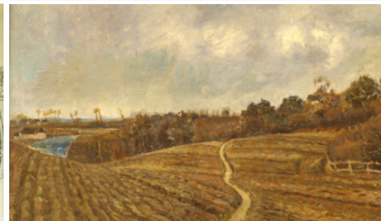
9 Fritz Syberg: Stien til Svanninge . 1892.

I Pumpemagergaarden i Svanninge boede familien Syberg til leje som nygifte i 1894. Senere købte familien Poppelhuset overfor, som siden gik i arv til datteren og svigersønnen Harald Giersing.