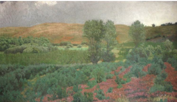
2 Jens Birkholm: Uvejr over Svanninge Bakker . 1905.

De fine støvede blå skygger på træstammer, stendige og hustage er med til at fremhæve oplevelsen af vinterkulden og -lyset.