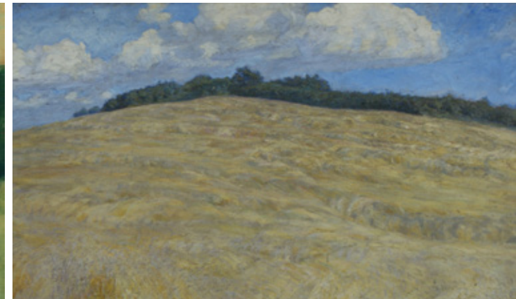
8 Peter Hansen: Moden rug . 1891.

På billedet ses Svanningevej, hvorfra Harald Giersing har malet et af sine mange motiver med Svanninge Kirke.