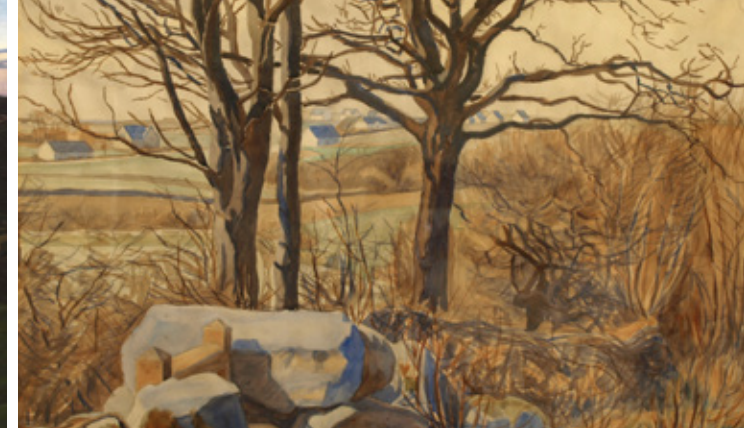
7 Fritz Syberg: Stenten i Svanninge . Tornehave. 1901.

Solnedgangen på Aftenleg i Svanninge Bakker kan læses symbolsk som en melankolsk afslutning på en epoke.