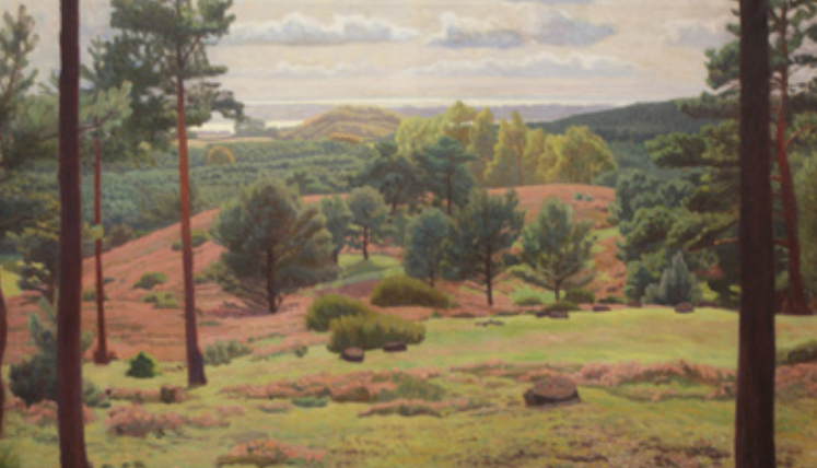
1 Jens Birkholm: Udsigt over Svanninge Bakker . 1912.

Birkholm formår at skabe dybde og rum i værket ved at lade vores blik glide ned over bakkeformationerne for til sidst at ende ved havets flade, rolige horisontlinje.