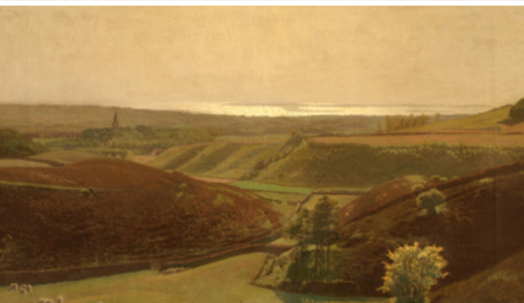
3 Jens Birkholm: Kistelåget . 1904.

Peter Hansen kom som ung malersvend tit på sin onkel og tantes gård, Tidselkroggaard. Der er derfor stor sandsynlighed for, at Peter Hansens værk "Moden Rug" skildrer en af gårdens marker.