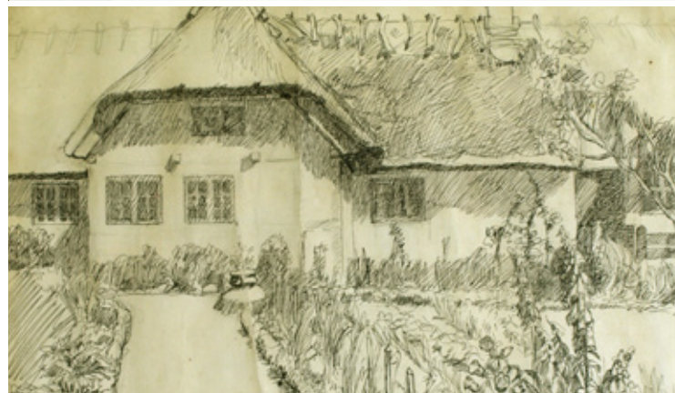
6 Fritz Syberg: Kunstnerens bolig i Svanninge . 1896.