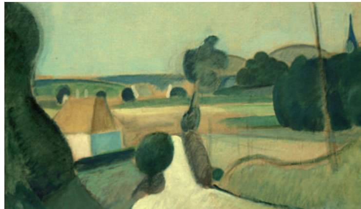
5 Harald Giersing: Landevej til Svanninge . 1919.

Motivet er et karakteristisk for Jens Birkholm, som er lykkedes med at fange lyset under de grå skyer.