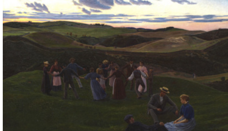
4 Fritz Syberg: Aftenleg i Svanninge Bakker . 1900.

Birkholm formår at skabe dybde og rum i værket ved at lade vores blik glide ned over bakkeformationerne for til sidst at ende ved havets flade, rolige horisontlinje.